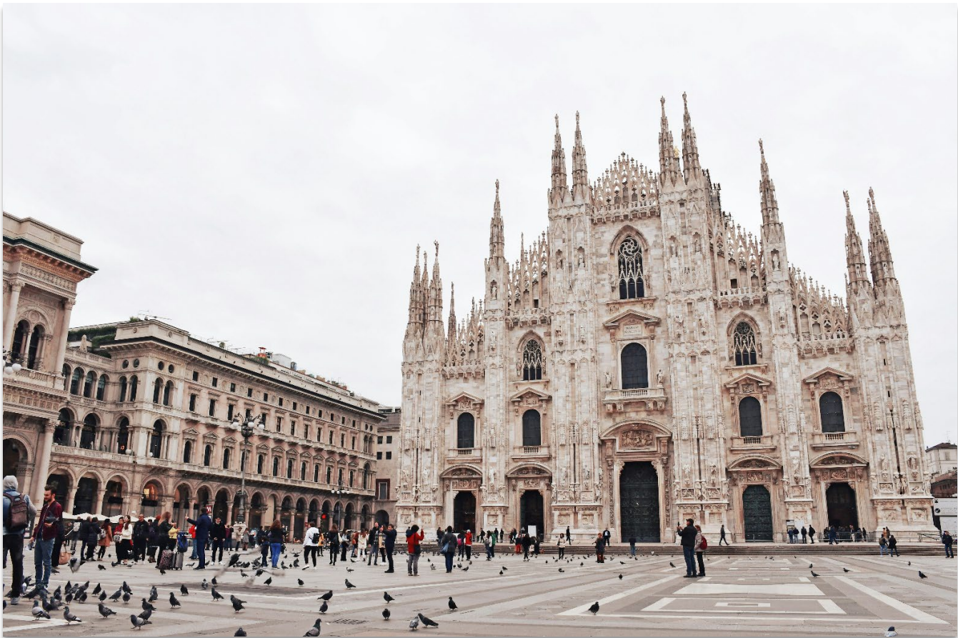
DUOMO DI MILANO

เมืองมิลาน (Milan) มิลานเป็นเมืองสำคัญทางตอนเหนือของประเทศอิตาลี ตั้งอยู่บนที่ราบลอมบาร์ดี โดยชื่อ "มิลาน" มีรากศัพท์มาจากภาษาของชาวเซลต์ คือ "Mid-Lan" ซึ่งมีความหมายว่า “กลางที่ราบ” เมืองมิลานมี ชื่อเสียงระดับโลกในด้านแฟชั่น ศิลปะ และวัฒนธรรม และยังเป็นหนึ่งในเมืองหลักทางเศรษฐกิจของอิตาลีอีก ด้วย นำท่านถ่ายภาพเป็นที่ระลึกบริเวณด้านหน้าของ “มหาวิหารมิลาน” (Duomo di Milano) หนึ่งในมหา วิหารสไตล์กอธิคที่ใหญ่ที่สุดในโลก (ค่าทัวร์ไม่รวมค่าเข้าชมในของมหาวิหารแห่งเมืองมิลาน)นอกจากนั้นให้