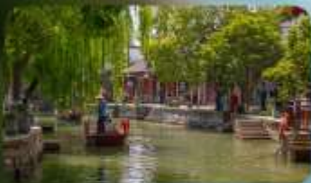
เมืองโบราณจูเจียเจีว

HOLIDAY INN EXPRESS HOTEL หรือเทียบเท่า 4 ดาว