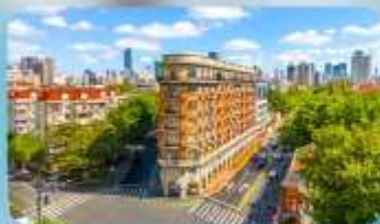
ถนนอันฟู