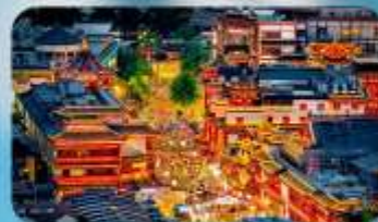
ตลาดร้อยปีเงินหวังเมี่ยว