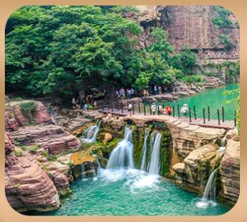
"อุทยานหยุนไท่ซาน"

ชมถ้ำหลงเหมิน มรดกโลกที่เมืองลั่วหยาง • สุสานจีนซีฮ่องเต้ • ศาลเจ้ากวนอู วัดเส้าหลิน + ป่าเจดีย์ + ชมโชว์กังฟู • เมืองโบราณลั่วอี้ • อุทยานหยุนไท่ซาน เจดีย์ห่านป่าใหญ่ • ถนนวัฒนธรรมต้าถัง • ถนนคนเดินอิสลาม • จัตุรัสหออระขิง