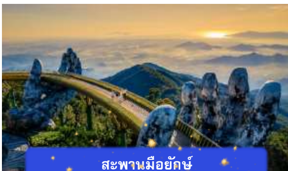
สะพานมียักษ์

เที่ยง อีศระอาหารกลางวันเพื่อความสะดวกในการท่องเที่ยว