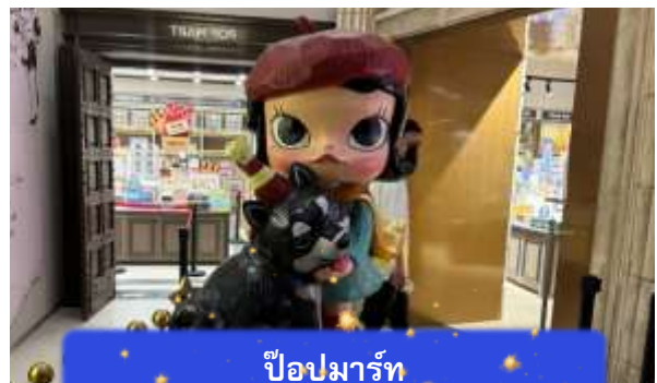
ป๊อปปาร์ท