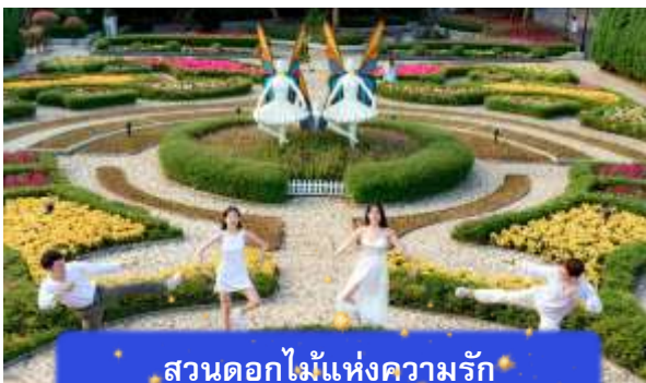
สวนดอกไม้แห่งความรัก

อิสระท่านท่องเที่ยว สวนสนุกแพนตาซีพาร์ค ซึ่งมีเครื่องเล่นหลากหลายรูปแบบ เช่น ทำทายความมันส์ของหนัง 4D ระทึกขวัญกับบ้านผีสิง เกมส์สนุกๆ เครื่องเล่นเบาๆ รถบั้ง หรือจะเลือกซื้อป๊ิงของที่ระลึกของสวนสนุก และ จัตุรัสแห่งดวงดาว เปรียบเสมือนการเดินทางสู่อาณาจักรแห่งดวงดาวที่มีเส้นทางเชื่อมต่อระหว่างอาณาจักรแห่งดวงจันทร์และอาณาจักรแห่งดวงอาทิตย์ถนนที่แสนงดงาม และสถาปัตยกรรมที่ล้ำสมัยจุดเด่นของที่แห่งนี้ก็คือกระจกใสทรงสามเหลี่ยมที่ดูคล้ายกับพิพิธภัณฑลู่ฟวร์ที่ฝรั่งเศส ให้ความรู้สึกลเหมือนท่านกำลังท่องอยู่ในโลกแห่งเวทมนต์และดวงดาว (ไม่รวมค่าเข้าชมหุ่นขี้ผึ้งราคาประมาณ 1 แสندอง)