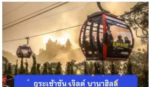
กระเช้าชัน เวิลด์ บานาฮิลล์