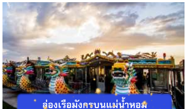
ล่องเรือมังกรบนแม่น้ำหอม

ที่พัก THANH BINH HOTEL ระดับ 4 ดาวมาตรฐานท้องถิ่น หรือเทียบเท่า