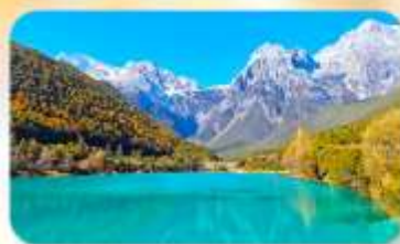
ทะเลสาบโป๋สุยเหอ