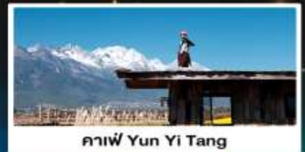
คาเฟ่ Yun Yi Tang