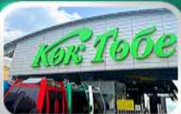
ซิมบูตอกเบซิมวีวอลมาตี

นั่งกระเช้าซิมบูลัค • ทะเลสาบโคลไซ • โบสถ์เซนต์พอล