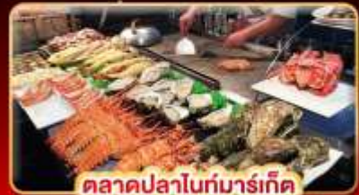
ตลาดปลาไถ่บ่มาร์เก็ต