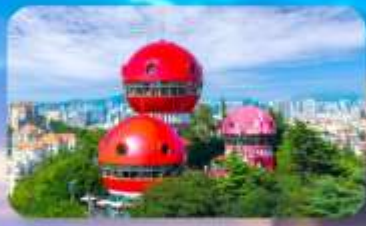
จุดชมวิว SIGNAL HILL