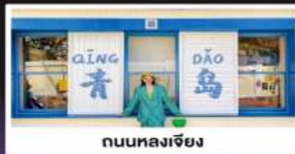
ถนนหลงเจียง