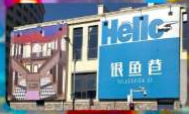
ตรอกซิลเวอร์ฟิช