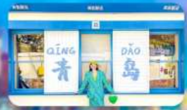
ถนนหลงเจียง