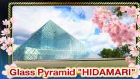
Glass Pyramid "HIDAMARI"