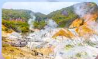
โอบิโรบงส์