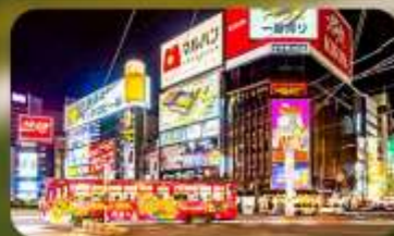
ซูปป์ิงย่านซุซุกิโนะ