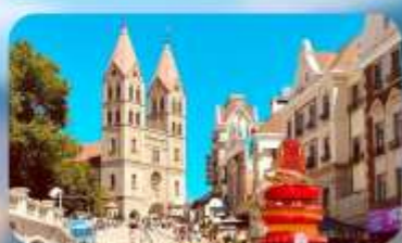
โบสถ์เซนต์โมเคิล