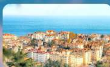
จุดชมวิว Signal Hill Park