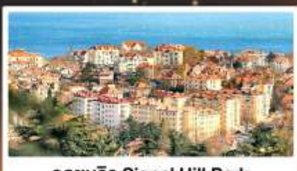
จุดชมวิว Signal Hill Park