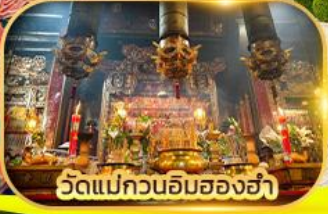
วัดแม่กวนอิมสองฮ่า