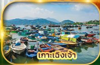
เกาะเจิงเจ้า