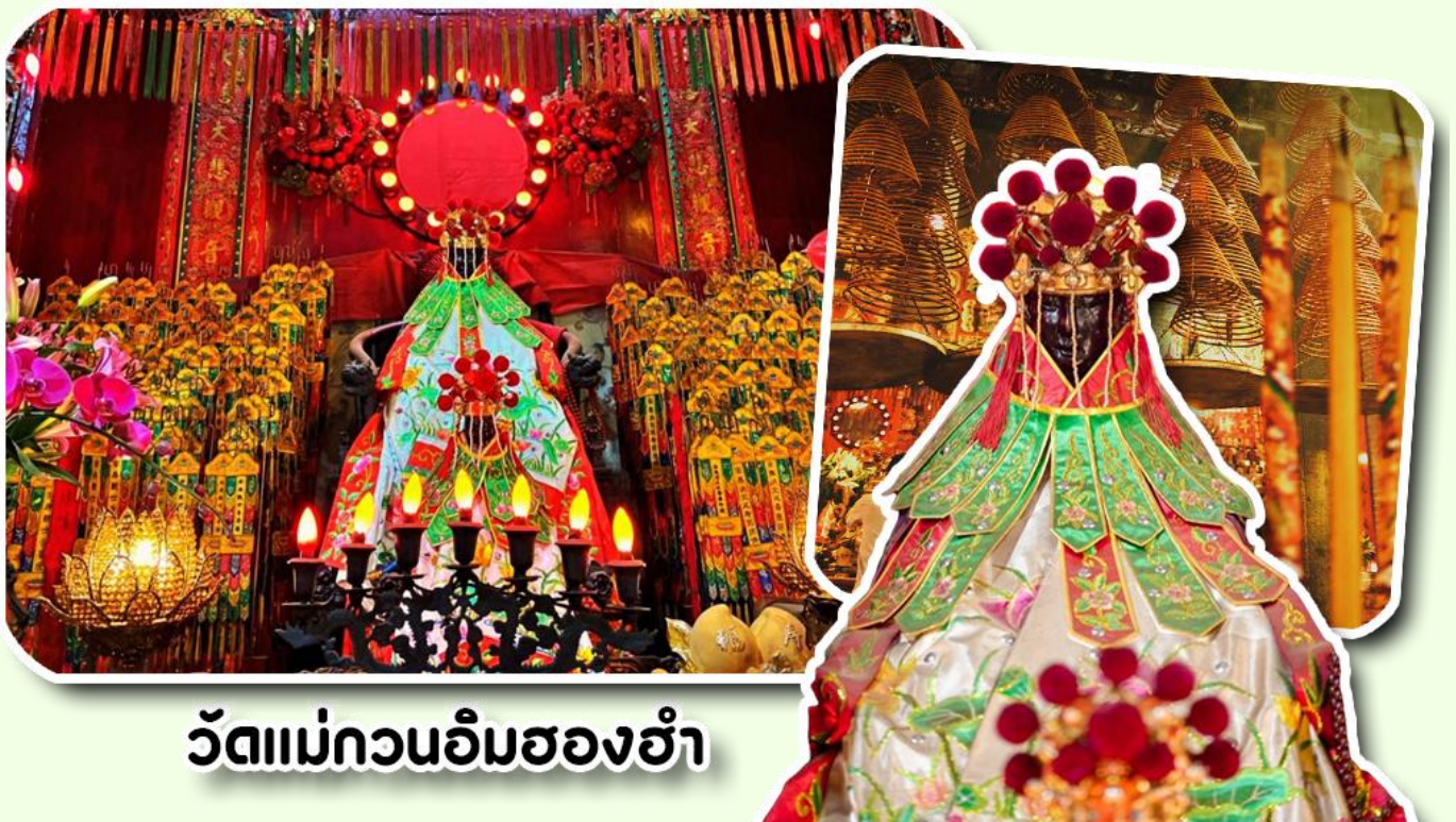
วัดแม่กวนอิมสองฮำ

ฮ่องกงสร้างตั้งแต่ปี ค.ศ .1873 เป็นวัดขนาดเล็กที่มีชาวฮ่องกงศรัทธานับถือกันเป็นอย่างมากวัดแห่งนี้เป็นที่ ประดิษฐาน องค์เจ้าแม่กวนอิมสองฮำ ที่มีชื่อเสียงเรื่องการให้กู้ยืมเงินเชื่อกันว่าท่านช่วยพลิกฟื้นเศรษฐกิจของชาวฮ่องกง ผู้คนจึงนิยมมาขอยืมเงินทำธุรกิจจนสำเร็จร่ำรวย รุ่งเรืองโดยให้ท่านอธิษฐานขอพรต่อหน้าเจ้าแม่กวนอิมสองฮำพร้อมกับระบุ วันเวลาในการขอพรด้วย จากนั้นนำธนบัตรตามฐานะและศรัทธาที่เราจะนำเป็นสื่อในการขอพร เขียนจำนวนเงินที่ต้องการ ลงไปด้วย ใส่สกุลเงินยิ่งใหญ่ แล้วนำเงินใส่ในซองแดง ควรเตรียมซองแดงไปเอง นำซองแดงไปวนรอบกระถางรูป วนขวา จำนวน 3 ครั้ง แล้วเก็บซองแดงในกระเป๋าสตางค์ เป็นเงินขวัญถุง ถ้าประสบความสำเร็จตามที่มุ่งหวัง ให้นำเงินในซองแดง ทำบุญหยอดตู้ที่วัดแห่งนี้ในโอกาสต่อไป