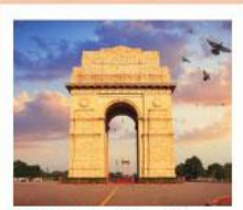
♥♦♦ India Gate