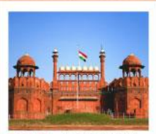
♥♦♦ Agra Fort