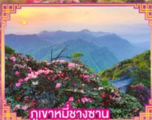
ภูเขาหมีช้างซาน