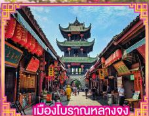
เมืองโบราณหลางจง